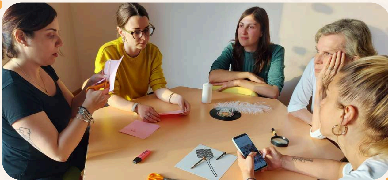
Foto 1. Formazione CPT ATS XX (2023-2025)

“La totalità è ben diversa dalla somma delle parti che la compongono e soprattutto possiede qualità e dinamiche precise”