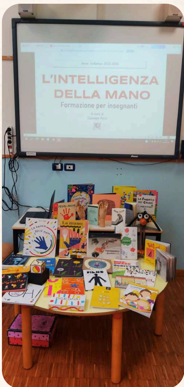
Foto 2. Formazione CPT ATS XX (anno scolastico 2025-2026)

“Qualcuno che guarda un muro, è una persona che guarda un muro: due persone che guardano un muro sono già un progetto di evasione”.